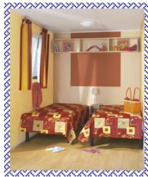
Coloris ambiance intérieure : Rouge Exotique