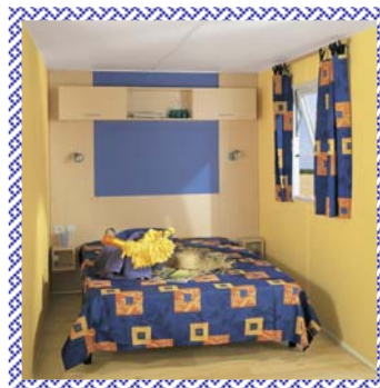
Coloris ambiance intérieure : Bleu Nocturne